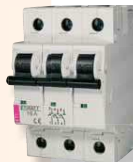
Ogranicznik mocy umownej ETIMAT T